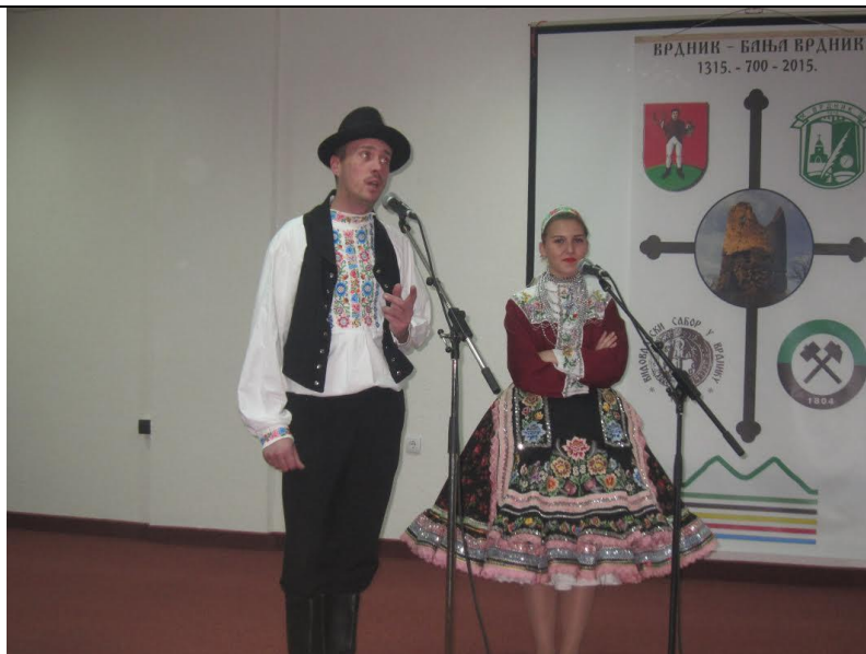
ВЕЛИКО ПУТОВАЊЕ КРОЗ ЧУДЕСНУ ИСТОРИЈУ ВРДНИКА: 700. година постојања Врдника