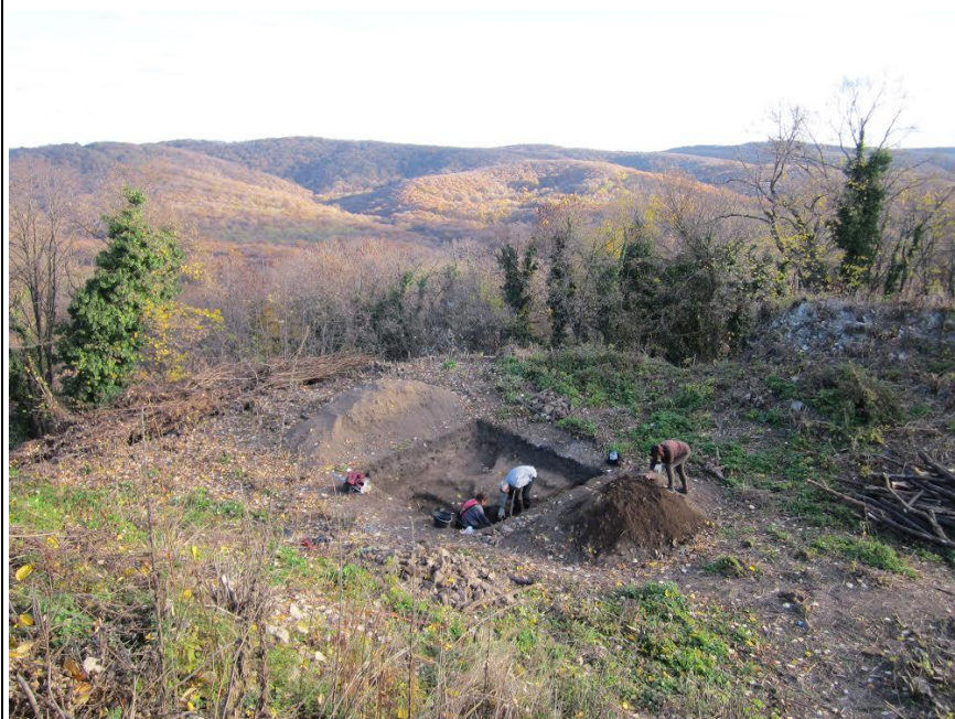
Археолошка ископавања Врдничке куле (2015. година)