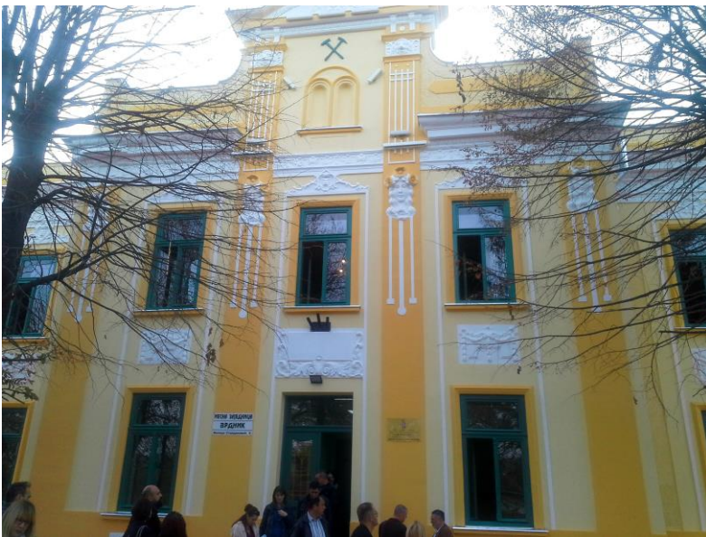
Адаптација Дома рудара (Касине)

прикупљања грађе, припреме и постављања сталне музејске поставке (2015-2017. година) у Дому рудара (Касине) у Врднику, чију је реализацију водио Музеј Војводине у Новом Саду; - извршена је адаптација и санација зграде Дома рудара (Касине) у Врднику, у оквиру подпројекта заштите и презентације индустријског и техничког наслеђа Врдника, са циљем обезбеђивања адекватног простора за реализацију културних садржаја у Врднику, смештај огранка библиотеке Српске читаонице у Врднику, смештај канцеларије месне заједнице и матичног уреда, али и део за смештај сталне музејске поставке посвећене седам векова дугој историји насеља Врдник; активности на реализацији адаптације објекта спровела је општина Ириг, и - обележавање јубилеја 700. година постојања Врдника манифестацијом ВЕЛИКО ПУТОВАЊЕ КРОЗ ЧУДЕСНУ ИСТОРИЈУ ВРДНИКА и припремањем документације за подизање споменика рудару испред Дома рудара (Касине) у Врднику. Активности везане за приступни пут Врдничкој кули, реализује, у оквиру својих надлежности и могућности, општина Ириг.