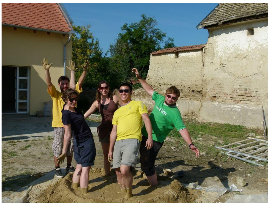
Пета летња школа архитектуре 2014. године