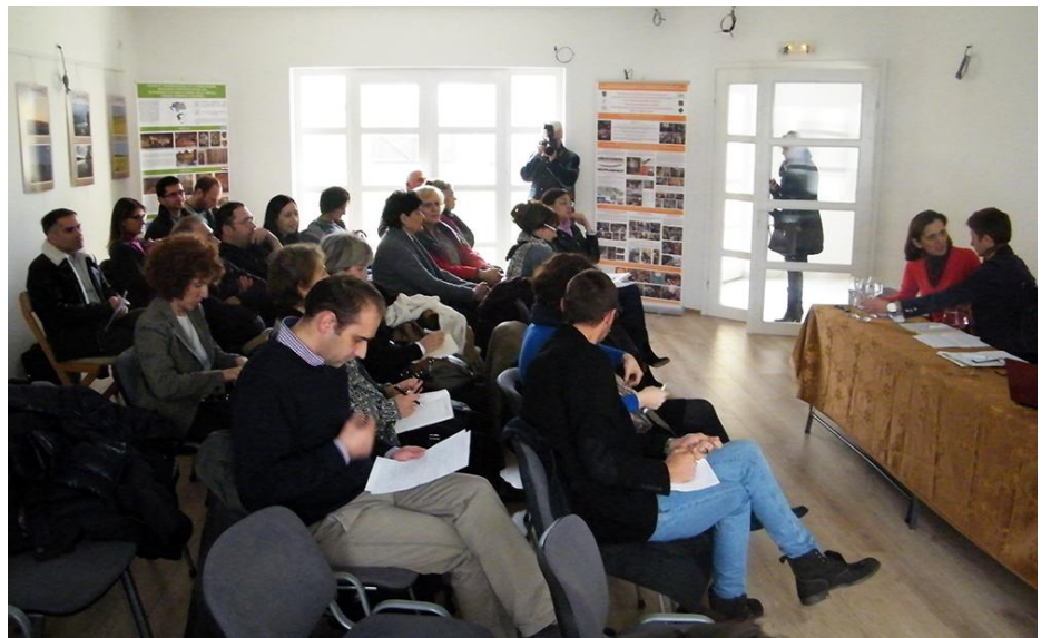
Радионица о Европској конвенцији о пределу