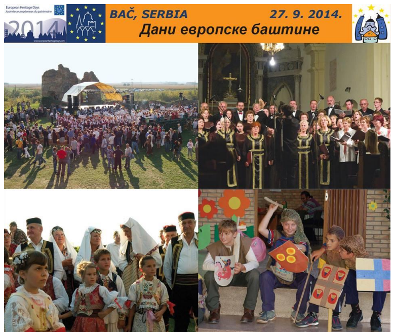
Дани европске културне баштине 2014. године