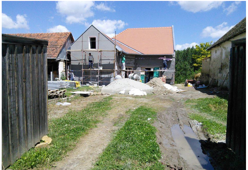
Едукативни центар ВЕКОВИ БАЧА