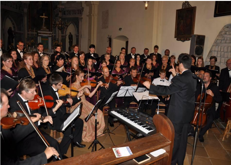
Дани европске културне баштине 2014. године